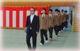
▲緊張した表情で入場です