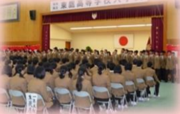
▲在校生による校歌紹介