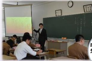
ICTを用いた授業 生徒もプレゼンに 挑戦!