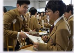
ALTによる 授業です 英語で自己 紹介できる かな?