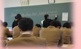
▲高校生活初のHR...ドキドキ

東鷹高校に165名の仲間が加わりました! 新入生のみなさん、これから一緒に学校を 盛り上げていきましょう!