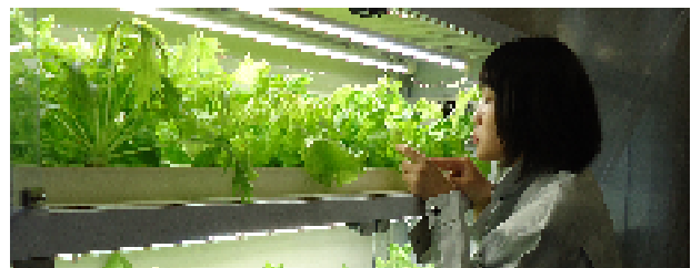
本校植物工場でのリーフレタスの栽培実習

全学科で実習時間・内容ともに充実しており、実践的に学べるのが本校最大の特徴です。